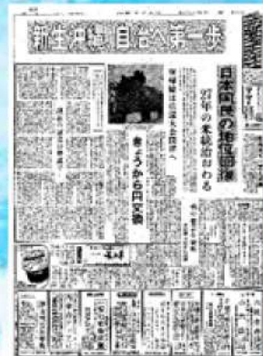
沖縄タイムス 1972年5月15日 朝刊

沖縄の地元紙である沖縄タイムスと琉球新報は、そうした住民の復帰への不安を大きく伝えています。地元紙が復帰をどのように伝えたか、当時の紙面と写真で紹介するとともに、復帰前後の沖縄をめぐる報道も取り上げます。また、沖縄が日本に復帰した1972年に国内外で起きたさまざまな出来事を報じる当館所蔵の号外・紙面も展示します。ハワイエでは、朝日新聞の沖縄復帰を捉えた写真を展示します。