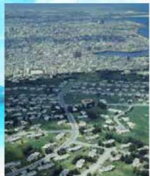
沖縄返還当時の那覇の市街地(奥)と米軍牧港住宅地区(手前)。地元住民の密集住宅地と対照的だ=1972年5月9日、朝日新聞社機から撮影