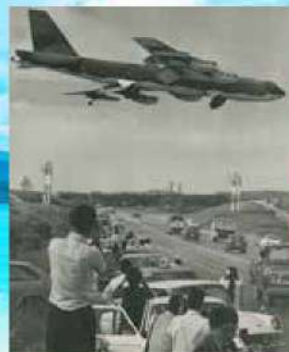
グアム島から台風避難を理由にB52核戦略爆撃機約90機が飛来。ベトナム戦の激化により各種軍用機の離着陸が相次いだ=1972年10月26日、米軍嘉手納基地