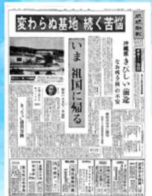
琉球新報 1972年5月15日 朝刊