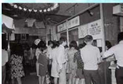
円で最初の買い物をしてもらおうと、デパート内に「私設」の円交換所が登場した=1972年5月15日、沖縄三越