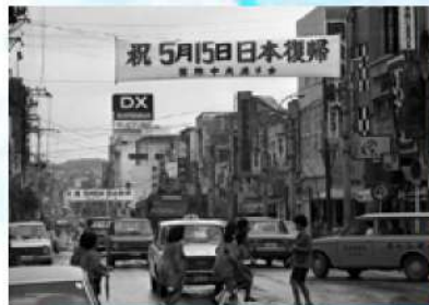
平和と豊かさの創造を掲げスタートした新生沖縄県。目抜き通りでは横断幕で祝意ムードを高めた=1972年5月15日、那覇市・国際通り