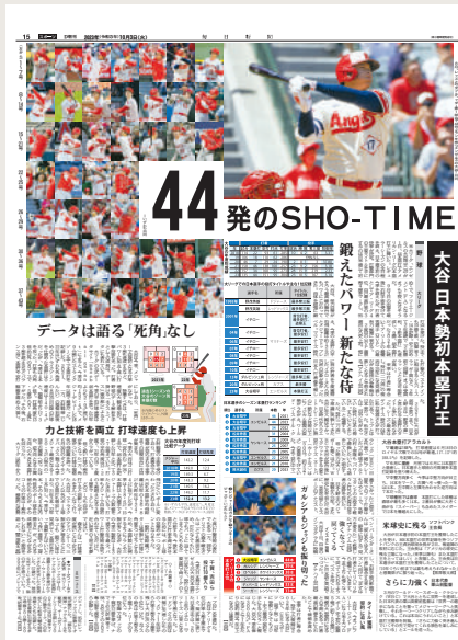
毎日新聞 2023年10月3日 朝刊

書体(フォント)も、読みやすさを求めて進化しています。デジタル版では、より多くの情報を伝えるため、動画や音声とテキストを組み合わせたり、ユーザーが操作できるグラフィックスを作成したりしています。本展では、社会生活に欠かせないニュースを届け、社会の共通理解を作っていくために、新聞社・通信社が取り組んでいる「情報デザイン」をご紹介します。