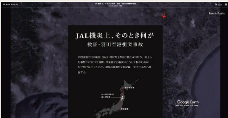
日経ビジュアルデータ「JAL機炎上、そのとき何が 検証・羽田空港衝突事故」日本経済新聞社 2024年1月

書体(フォント)も、読みやすさを求めて進化しています。デジタル版では、より多くの情報を伝えるため、動画や音声とテキストを組み合わせたり、ユーザーが操作できるグラフィックスを作成したりしています。本展では、社会生活に欠かせないニュースを届け、社会の共通理解を作っていくために、新聞社・通信社が取り組んでいる「情報デザイン」をご紹介します。