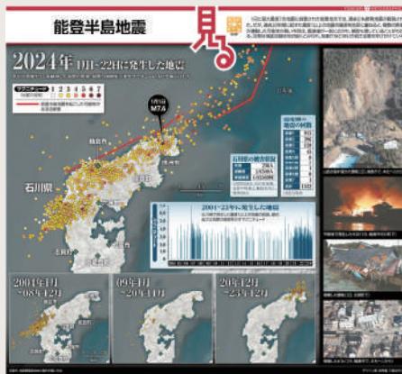
読売新聞 2024年1月28日 朝刊

聞紙面を生かし、グラフィックや表、写真とテキストを組み合わせた迫力あるインフォグラフィックスは、その優れたデザインが評価されています。新聞紙面には、たくさん情報要素を早く読み解くための工夫が凝らされています。記事の